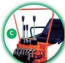
Hydraulický rozdělovač s ventily, pákové řazení a bezpečnostní blokování