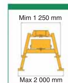
Série "B.A." pevný rám