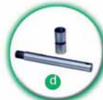
Povrchově upravené šrouby a pouzdra