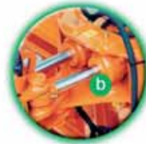
Dvojité písty s rotací o 180°