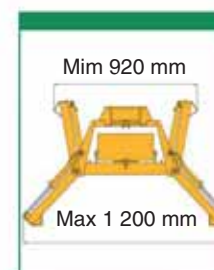
Série "B" pevný rám