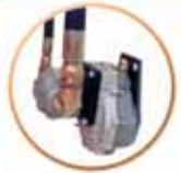
SÉRIE DIG-DIG Vysoce výkonné litinové čerpadlo

70 TMX TIX 75 TMX TIX 80 TMX TIX 85 TMX TIX